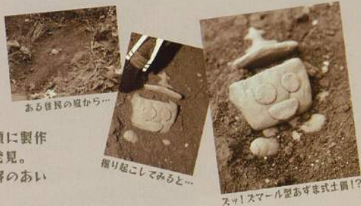
ある住民の庭から...